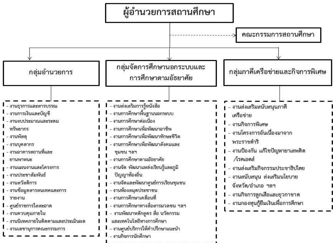
แผนภาพ 1 โครงสร้างการบริหารศูนย์การศึกษาอนุกระบบและการศึกษาตามอัธยาศัย อำเภอศรีราชา จังหวัดชลบุรี

ศูนย์การศึกษาอนุกระบบและการศึกษาตามอัธยาศัยอำเภอศรีราชา แบ่งโครงสร้างการบริหาร ออกเป็น 3 กลุ่มงาน คือ กลุ่มอำนวยการ กลุ่มจัดการศึกษาอนุกระบบและการศึกษาตามอัธยาศัยและ กลุ่มภาคีเครือข่ายและกิจการพิเศษ ดังแผนภาพ 1